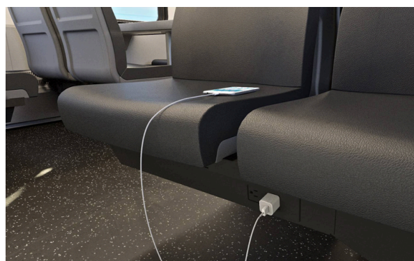
每个固定座椅有电源插座